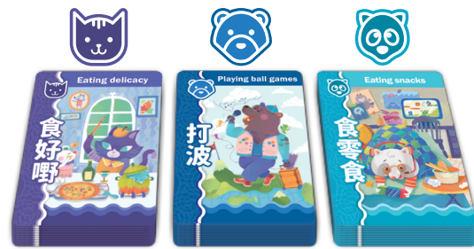
三組休閒活動詞語卡